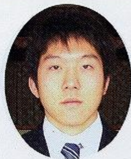
熊本大学 工学部 機械システム工学科