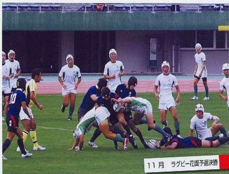
11月 ラグビー花園予選決勝